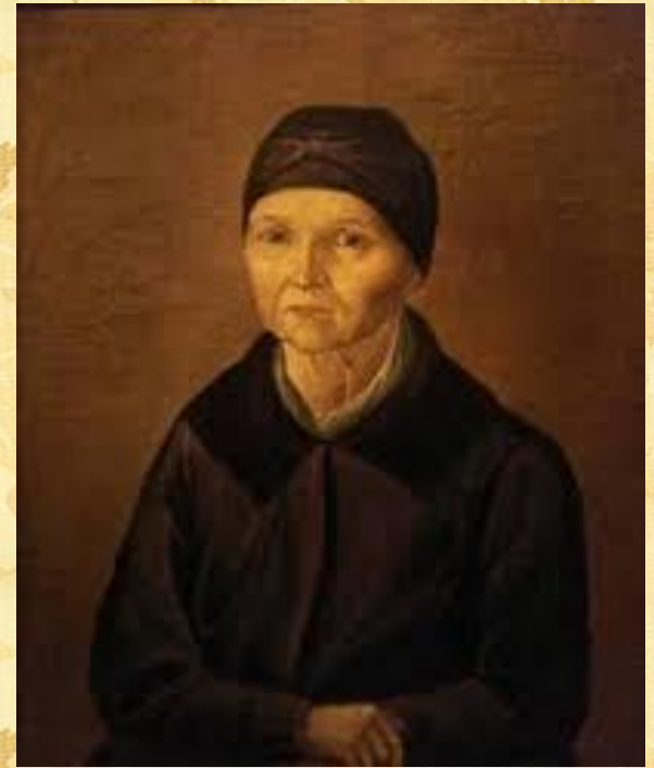
Яковлева Арина Родионовна

Любовь к родному языку маленькому Пушкину привили бабушка, Мария Алексеевна Ганнибал, превосходно говорившая и писавшая по-русски, и няня Арина Родионовна.