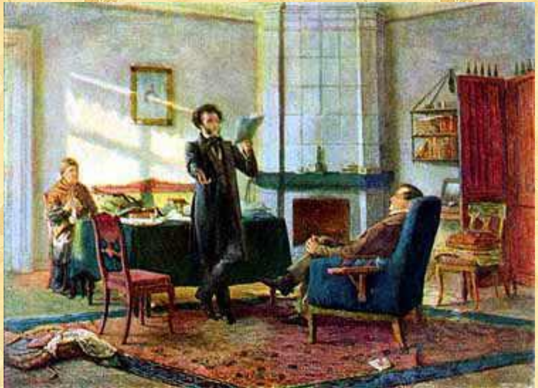
Пушкин в селе Михайловском (Пушкин у Пушкина). Н.Н. Ге. 1875 г.

За три года ссылки написаны "Кавказский пленник", "Бахчисарайский фонтан", а также "Узник", "Песнь о Вещем Олеге». Начат роман в стихах "Евгений Онегин".